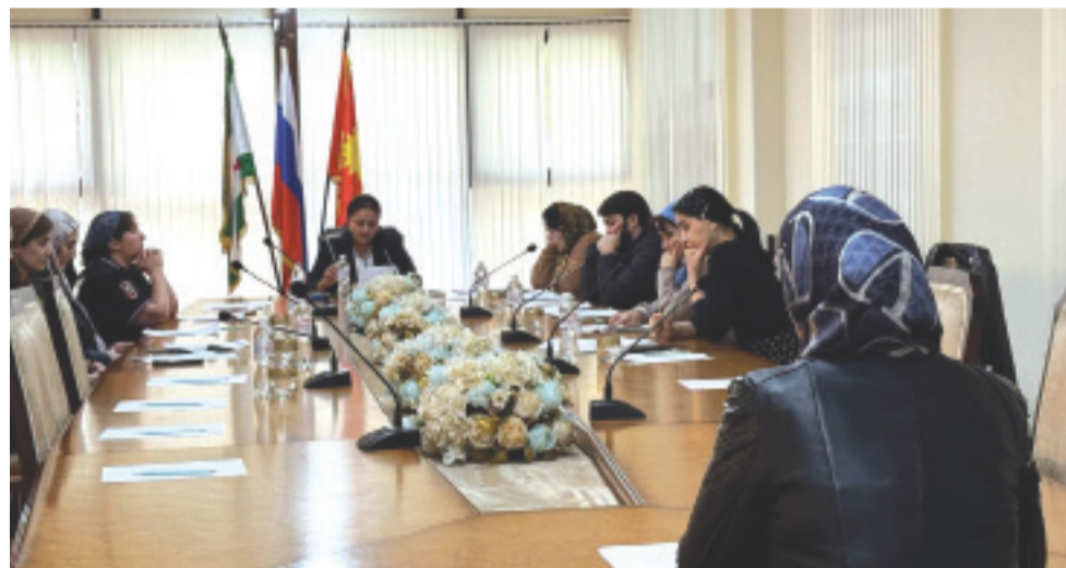
ко Дню Великой Победы

За такие действия предусмотрено предупреждение или наложение административного штрафа.